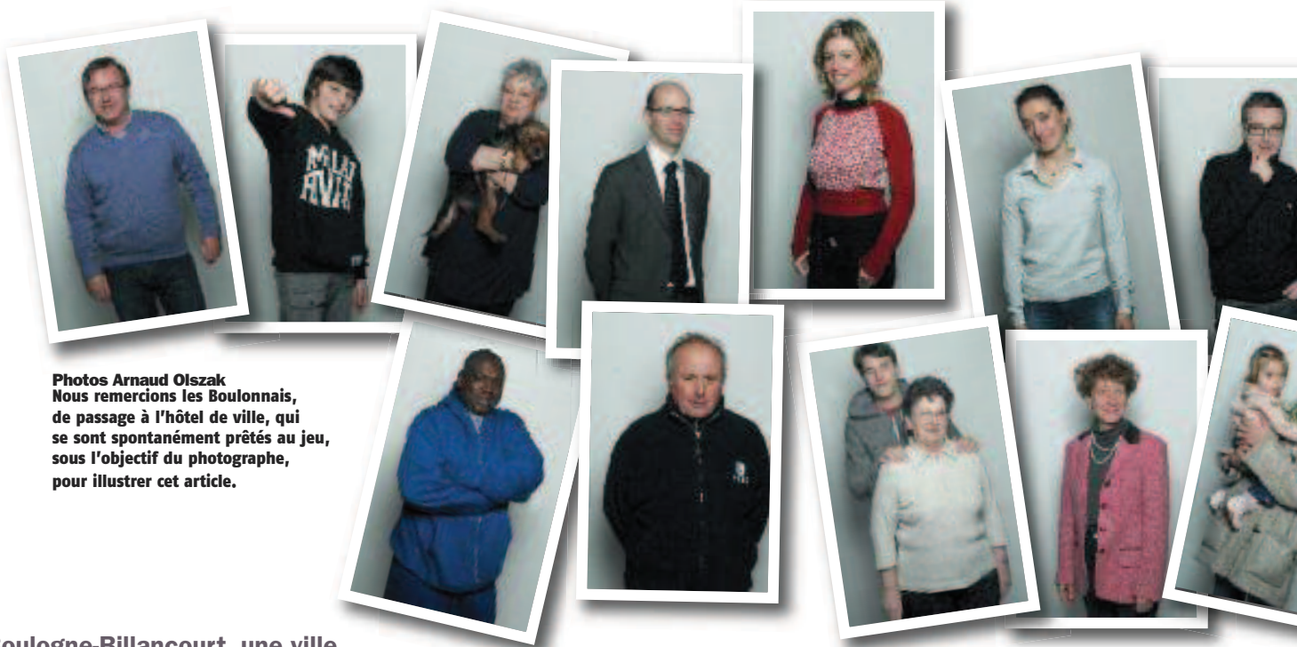
Nous remercions les Boulonnais, de passage à l'hôtel de ville, qui se sont spontanément prêtés au jeu, sous l'objectif du photographe, pour illustrer cet article.

Boulogne-Billancourt, une ville en mouvement. Depuis le dernier recensement de 1999, la population s'est accrue de près de 5 000 habitants. Si la moyenne d'âge des Boulonnais augmente légèrement, grâce en partie à la vitalité des seniors, d'autres caractéristiques se dégagent des chiffres de l'INSEE mis en perspective par le nouveau service Observatoire et statistiques de la Ville. La cité attire des jeunes familles avec un ou deux enfants, mais aussi des familles monoparentales de plus en plus nombreuses (+15 %). Par ailleurs, les personnes seules (en majorité des femmes), sont toujours aussi nombreuses. Elles occupent près d'un logement sur deux. Femmes, hommes, enfants, nouveaux arrivés, retraités, actifs, qui sont les Boulonnais ?